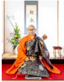
令和 3 年 總持寺焼香師