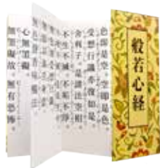
このひらサイズの 般若心経 500円