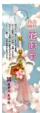
合格祈願 花咲守り 500円