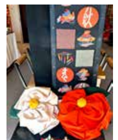
令和7年ひなまつり展