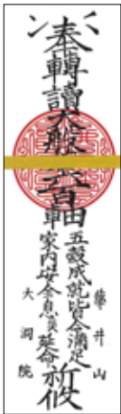
大般若祈祷札 高さ 24cm

大洞院の大般若祈祷札は、毎年正月の大般若経転読で祈祷して、家内安全・息災延命などの願いを込めてお授けします。この般若札は各家庭の1年間の護符ですから、魔除けとして家の入口、玄関内の高所に貼るか、仏壇に置きます。新しい祈祷札を頂いたら1年前の古い札と入れ替えます。古い札は大洞院でお焚き上げします。