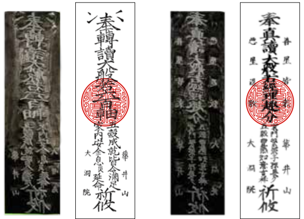
大般若祈祷札 高さ 31.5cm

版木の裏には、明治28年と書いてあります。それまでの版木が摩耗した為、作り替えたものと考えられます。