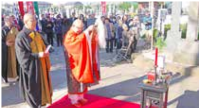
平成 30 年 晋山式 山門香語

令和 8 年には、就任 20 周年を節目に、大洞院の歴史を振り返る「大洞院歴史展」をギャラリーで開催したいと考えています。大洞院の歴史を物語る写真、物品などがありましたら、ご提供ください。