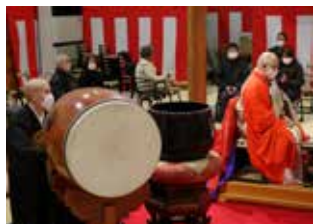
本堂での除夜祈祷

お正月は特別に金剛鈴と太鼓で厄除け祈祷を行います。どなたでも参加頂けます。本堂にお入りください。