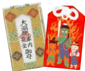
各種布製お守り 300円