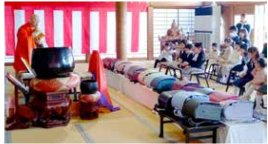
令和 7 年 ランドセル祈禱