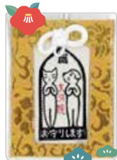
「いぬねこぞう」 お守り 300円