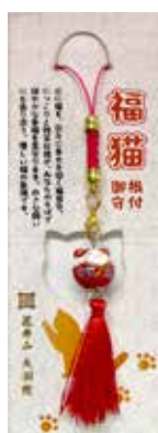
開運招福 福猫守り 500円