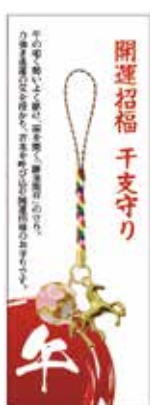
令和八年干支(午年)守り 開運招福 厄除け 300円