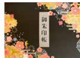
見開き御朱印帳 2,200円