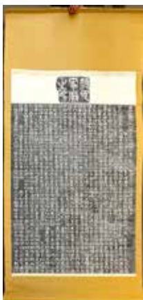
顔氏家廟碑拓本 (全長3.5メートル)