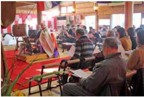
本堂での新年祈祷

特別に「不動明王」を祀り、本堂を散華を撒いて浄め 開運招福、身体健全、疫病退散、厄除けなどを祈願します。