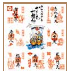
七福神巡り用色紙

大洞院の毘沙門天などに柏に設置された「かしま七福神」を巡って参拝し、御利益を頂きましょう。