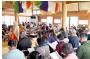
令和7年春彼岸法要

家族揃って合同法要に出席することは、故人に感謝するとともに、先祖との命のつながりを感じる貴重な機会です。自分たちが決して一人ではないことを子や孫に伝え、自分自身を大切にすることを育むことになります。