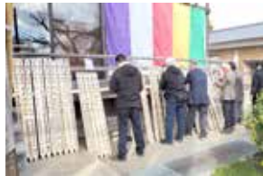
法要後 本堂前で塔婆受け渡し