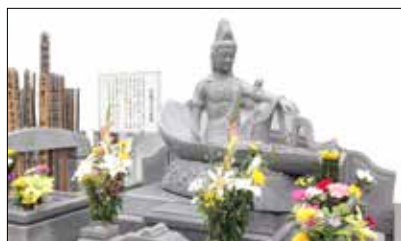
一葉観音 (西墓地 合祀墓)