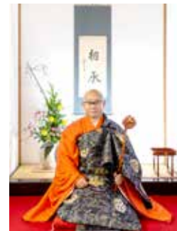
令和3年 總持寺 焼香師