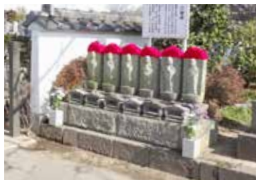
六地藏尊 明和5年(1768)に念仏講(花野山門前) 井村の檀信徒が寄進。

大洞院の境内には、室町時代からの歴史を観てきた大銀杏、260年前に村人が寄進した六地藏尊などがあります。散策をお楽しみください。