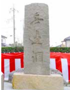
渡邊國武「無邊洞」碑

大銀杏の傍にある弁天堂には、頭上に宇賀神と鳥居を載せた八臂座像の弁才天像を祀っています。