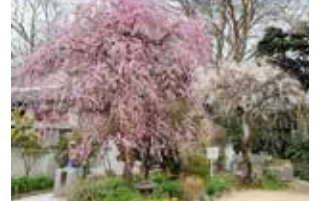
枝垂れ梅(見頃：2月初旬～中旬)

樹高15.5m、幹周5.2mの雌木。江戸時代には、利根川水運の目印に。秋には銀杏を拾うことができます。