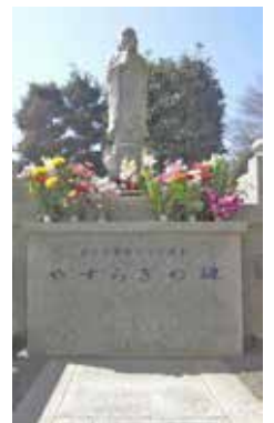
ペット合祀墓「やすらぎの碑」