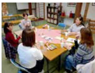
みんなとおしゃべりでリフレッシュ

子育ての悩み共有や、気分転換のおしゃべりなど、子育て世代の為の場として、ご利用ください。