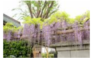
藤棚(見頃：5月中旬～下旬)