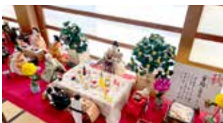
↑本堂廊下ジオラマ 大洞院ギャラリー展示→

寄贈の雛人形を飾る「ひなまつり展」を開催しています。七段飾り、三段飾り、吊るし雛や帯飾りなど展示します。本堂に続く廊下には、雛人形を使用した季節の行事のジオラマなど、ユーモアあふれる作品も展示しています。