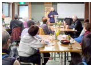
珈琲を飲みながら法話会

「珈琲を飲みながら住職の法話を聞き、心地よい体験ができました」と参加者から喜びの声が寄せられました。