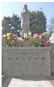
やすらぎの碑 (本堂西側) ペット供養墓