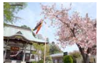
八重桜(見頃：4月下旬～5月初旬)