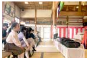
令和7年ランドセル祈禱

当日は、子供たちのランドセルやカバンを並べて学業成就、身体健全、交通安全を祈禱します。地域の方に広く参加いただけます。