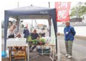
令和7年秋彼岸門前バザー