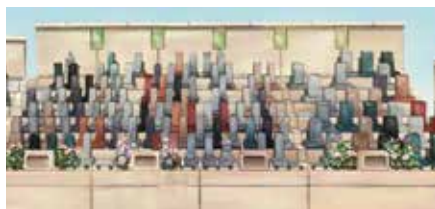
ちいさなお墓（完成予想図）