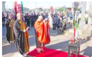
平成30年 晋山式山門香語