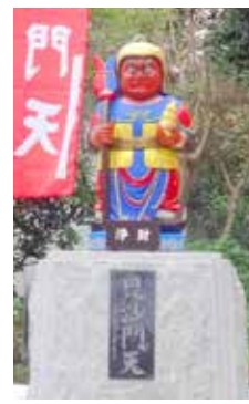
かしま七福神 毘沙門天 (境内西側) 彩色：長縄えい子

大洞院の毘沙門天などに柏に設置された「かしま七福神」を巡って参拝し、御利益を頂きましょう。