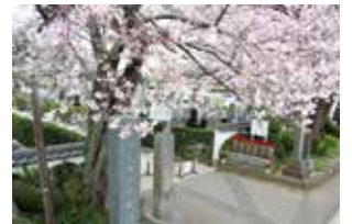
山門の桜(見頃：3月下旬～4月初旬)