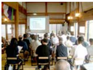
令和7年 秋彼岸世話人会

大洞院は「みんなのお寺、私たちのお寺、わたしのお寺」として檀家に情報公開するとともに、できる範囲で力を出し合って運営しています。