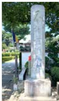
かいだんせき 戒壇石(山門前)