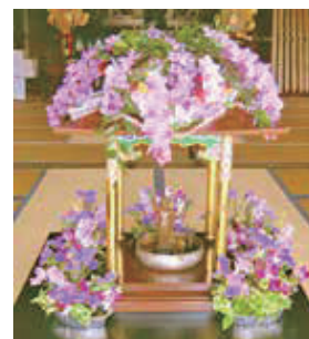
花御堂 (はなみどう)

花御堂を飾る頃、大洞院山門の桜は例年満開を迎えています。満開の桜と花御堂を両方お楽しみください。