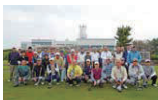
令和元年 ゴルフコンペ集合写真