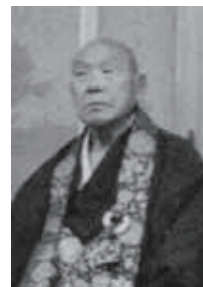
二十九世(谷内)千秋流芳大和尚