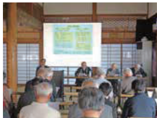
令和2年 春彼岸世話人会